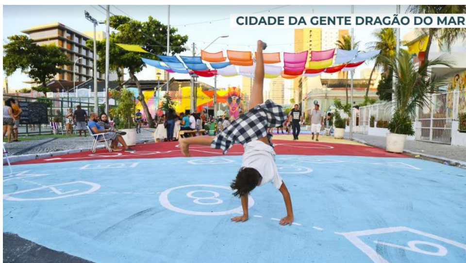
Příklad play street Fortaleza, Brazílie